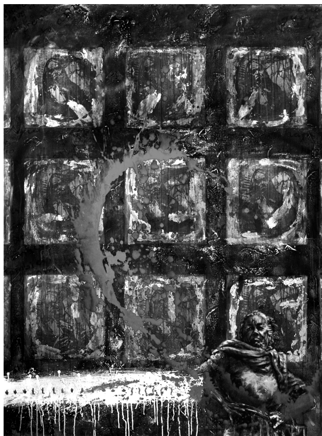
Afirmaciones y negaciones. Acrílico sobre tela. 1996

aprendizaje. Cinco grandes teorías convergen suministrando un cuadro coherente de las consecuencias de la motivación en el aprender, que son las siguientes: 1. Competencia; 2. Autodeterminación; 3. Concepto y percepción de sí mismo; 4. Motivación a conseguir éxito; 5. Atribución (Boscolo, 1997, Marzano, 2003). A éstas Stipek (2003) ha añadido la teoría más moderna de la orientación sociocultural que pone de manifiesto el hecho de que un contexto social adecuado –compañeros, docentes, escuela y padres– apoya el sistema motivador, ayudando en particular a persistir enfrentándose con dificultades, y asimismo el que es necesario que cada discente se enfrente efectivamente con un nivel correcto de dificultades, con unos desafíos aptos para envolverlo.