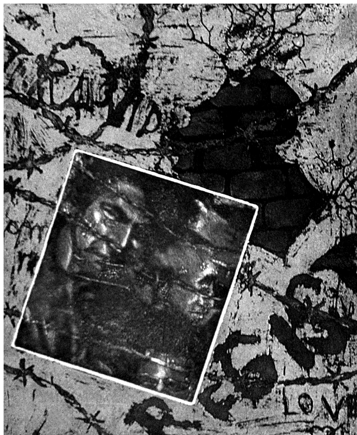
El triunfo de la libertad es el nombre de una calle I. Detalle. Roll up. 1996

En esta línea Dunn y Dunn señala que los estilos de aprendizaje son las modalidades preferidas por un discente respecto a la mejor manera de conseguir concentración y el aprender información difícil. La importancia está en las interacciones: a. Con el ambiente: algunas bipolaridades son, por ejemplo, silencio-sonido, luz baja-luz fuerte; b. Con los demás: aprendizaje individual-colaborativo, presencia de autoridad-ausencia de autoridad, repetición-creatividad; c. Con el cuer-