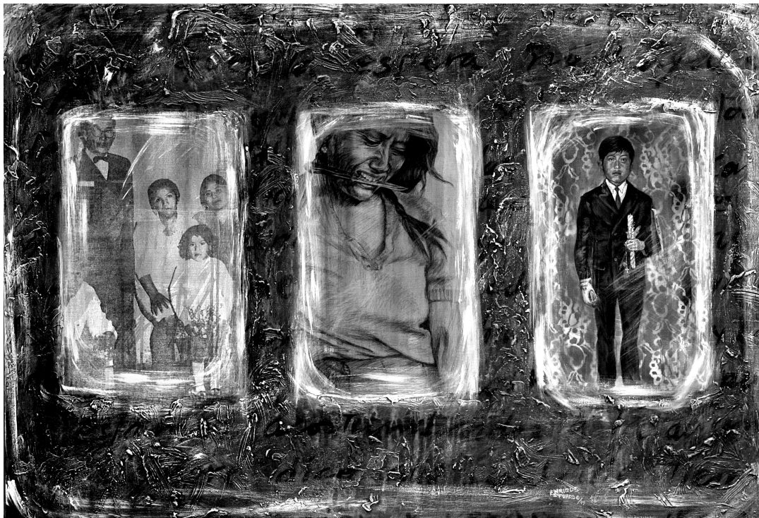
Memoria en. Acrílico sobre tela. 1998