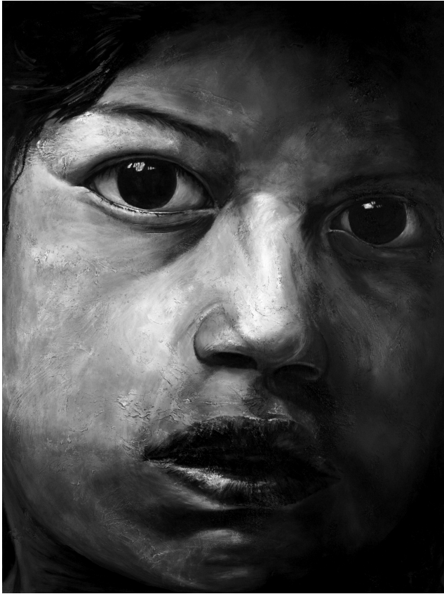
Quilago (32 módulos). Acrílico sobre tela. 2004

cimientos reales; 2. Entender los hechos y las ideas que caracterizan “el pensamiento y la acción” del contexto de qué se trata (disciplinario, profesional, social, etcétera); y, 3. Organizar sus conocimientos de tal manera que pueda facilitar su recuperación y aplicación. Esto supone profundizar la enseñanza de algunos asuntos, suministrando ejemplos de la forma de aplicar el concepto en la realidad.